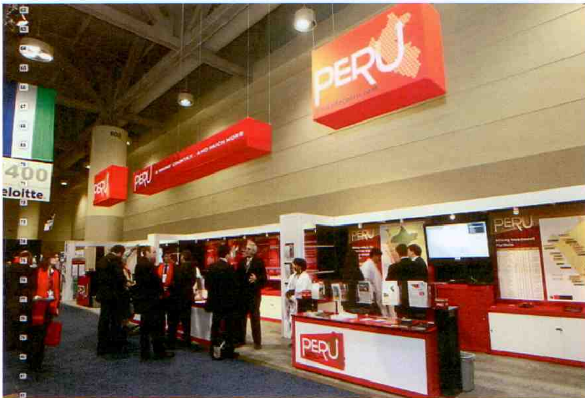
Figura Nro 1: Stand del Perú (uno de los mas grandes del evento)

Toronto – Canadá 05 de marzo al 10 de marzo del 2011